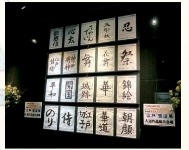
YUITO日本橋室町野村ビル