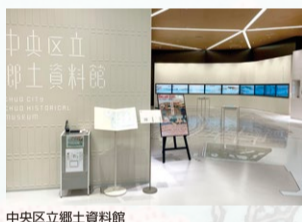
中央区立郷土資料館