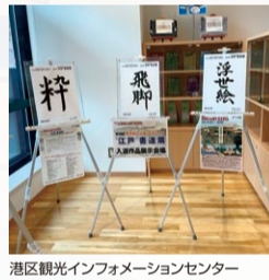
港区観光インフォメーションセンター