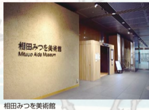
相田みつを美術館