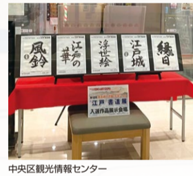
中央区観光情報センター