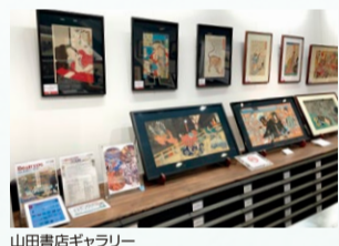
山田書店ギャラリー

相田みつを美術館、伊場仙浮世絵ミュージアム、江戸屋所蔵刷毛ブラシ展示館、奥野かるた店「小さなカルタ館」、江東区深川江戸資料館、すみだ北斎美術館、風の博物館、中央区立郷土資料館、日枝神社「宝物殿」、明治大学博物館、山田書店ギャラリー