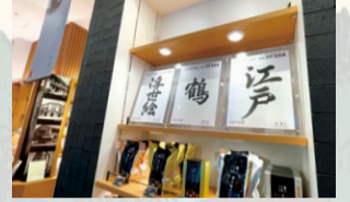
にんべん 日本橋本店