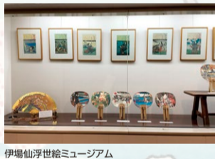
伊場仙浮世絵ミュージアム