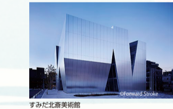
すみだ北斎美術館