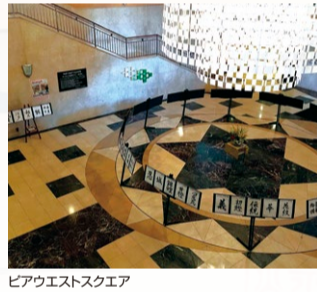
ピアウエストスクエア