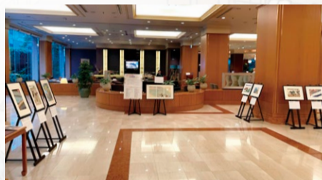
ロイヤルパークホテル