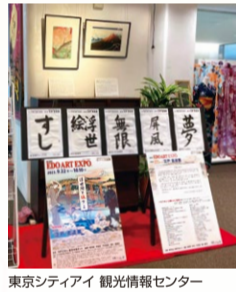
東京シティアイ 観光情報センター