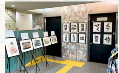
千代田区観光案内所