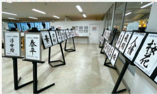
東京シティアターミナル