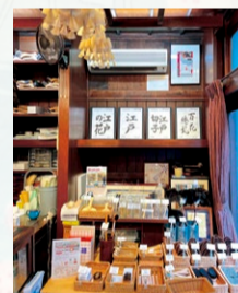
江戸屋/江戸屋所蔵刷毛ブラシ展示館