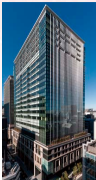
COREDO室町2室町古河三井ビルディング