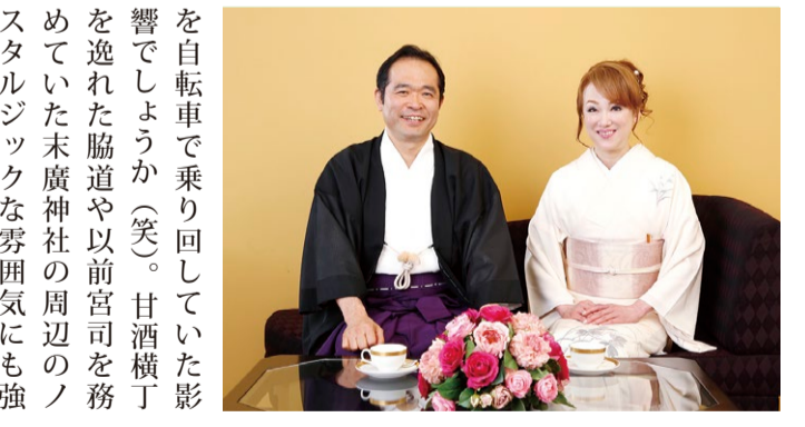
山田 当団体が事業展開する、「日本橋美人」という江戸(東京)の地域ブランドがあります。「日本橋美人」とは、どのような女性像をお持ちですか。

山田 来る「第9回 EDO ART EXPO」2016年9月23日(10月11日)は「美は遺産」を江戸のDNAをコンセプトに開催します。中央区、千代田区、港区、墨田区の名店、企業、ホテルや文化・観光施設の60カ所以上がパビリオン(会場)となり江戸から続く伝統や文化、歴史に関する展示を行う予定です。前回の平成27(2015)年には、国内外を含め約40万9千人の方が各会場を訪れてくださいました。そして同時開催の「東京都の児童・生徒による「江戸」書道展」は、5回目の記念の年にあたります。